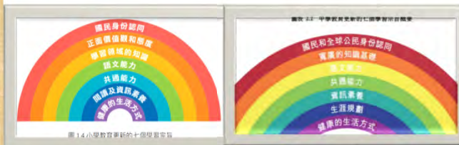
《小學教育課程指引》(2022)

為提升學校通過「策劃-推行-評估」循環的自評效能貫徹以改善學生學習成果為架構的核心，由2022/23學年起，學校進行自評時須 更聚焦於七個學習宗旨 ，並以此 作為自評的反思點 ，綜合運用香港學校表現指標和自評資料及數據，從 整體角度評估 學校在培育學生相關素質方面的工作做得有多好，以反映學校對 改善學生學習成果的效能